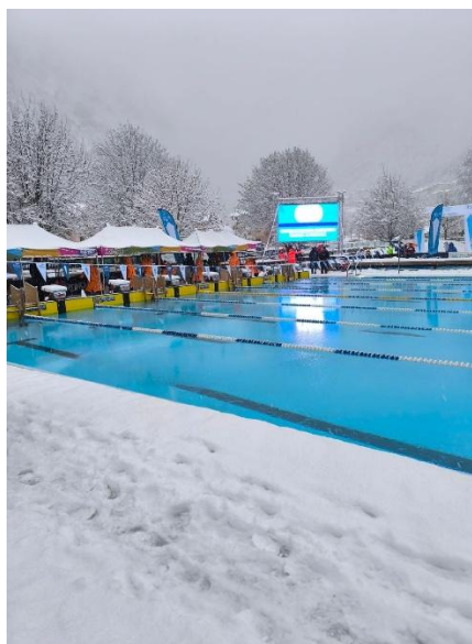
Molveno Olympic Pool

50m Bahn – Wassertemperatur 1,0 - 2,5 Grad