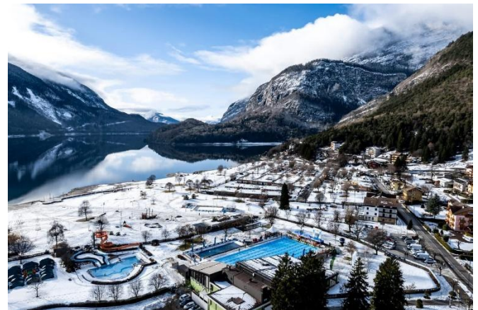
Molvemo Pool und See