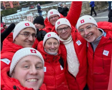
Einige aus der Schweiz: